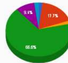
■ AÇÕES-OUTROS ■ CDI ■ IMA-B